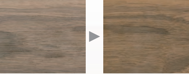
日焼け前(標準塗装見本)

濃くはっきりとした木目が、年を経るにつれ、穏やかな色調に落ち着きを見せます。エイジングがもたらす変化は、ピアノとともに時間を歩む楽しみも生み出します。