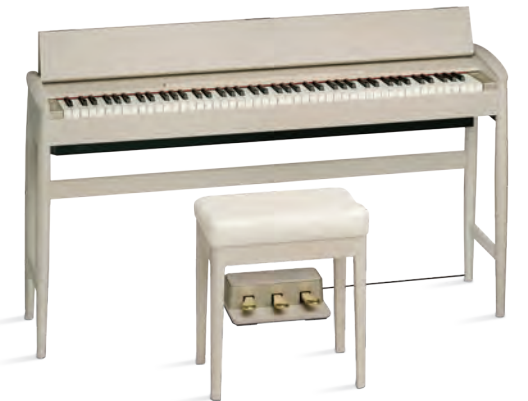
シアーホワイト (品番 KF-10-KS)オープン価格 樹種:オーク

天然木オーク材ならではの素材感、木目を活かしながら、 透明感のある白い塗装を施しました。 洗練されたお部屋の空間を演出します。