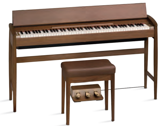
ウォールナット (品番 KF-10-KW)オープン価格 樹種:ウォールナット

深みのある色合い、上品かつ艶やかな木目。時を経るごとに 落ち着いた風合いに変化する高級木材ウォールナット。 シックで上質なたたずまいを醸し出します。