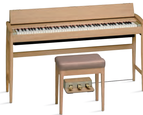
ビュアオーク (品番 KF-10-KO)オープン価格 樹種:オーク

ナチュラルな風合い、繊細で美しい木目のオーク材は、 お部屋をやさしい雰囲気満たします。 天然木の自然な表情を活かした特別な塗装も施しています。