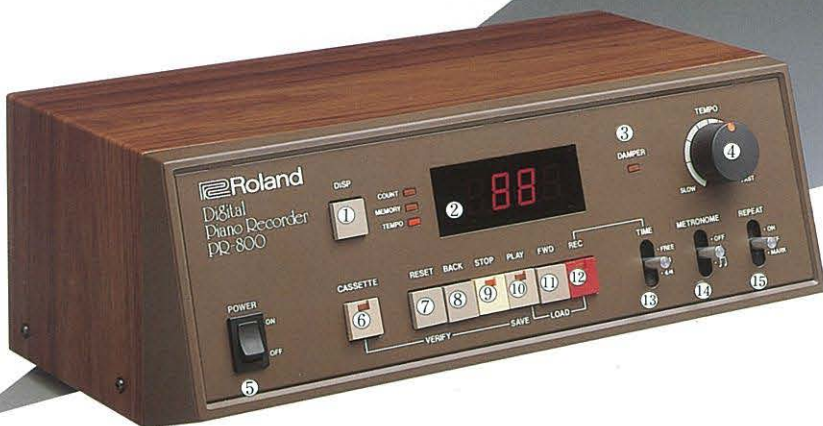
(デジタル・ピアノ・レコーダー)

①ディスプレイ：テンポと記憶残量(%), 小節数をディスプレイに表示するスイッチ。②ディスプレイ：①のボタンで表示が変わります。③ダンパー・インジケータ：演奏時のダンパー・ペダルの入・切も、ひと目でわかります。④電源スイッチ。⑤カセット：カセット・テープに演奏データを録る時に使います。⑥リセット：瞬時に記憶した曲の最初(1小節目)に戻せます。⑦バック：テープ・レコーダーの巻戻しと同じです。⑧ストップ：演奏停止。⑨プレイ：演奏スタート。⑩フォワード：テープ・レコーダーの早送りと同じです。⑪レック：プレイと一緒に使って演奏を記憶。⑫タイム：記憶する曲の拍子によって切替えます。⑬メトロノーム：演奏を記憶させる時に便利な電子メトロノーム。⑭リビート：アルペジオ、ベース・パターンに効果的に使える繰り返し演奏機能。