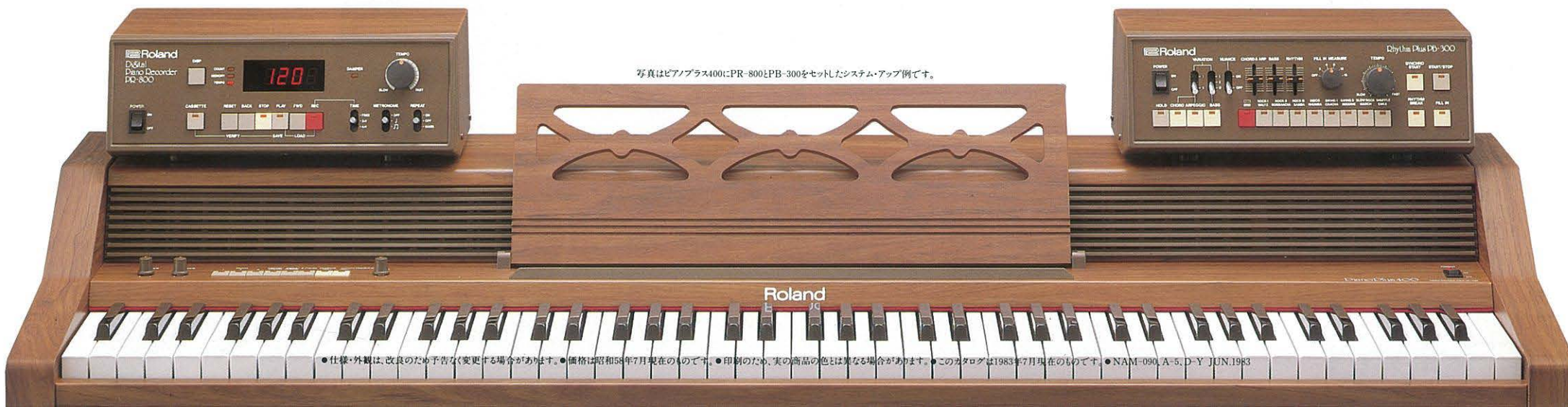
写真はピアノプラス400にPR-800とPB-300をセットしたシステム・アップ例です。

●外形寸法：314(W)×118(H)×172(D)mm ●重量：2.3kg ●付属品：DINコード(×2)、接続コード、電源コード