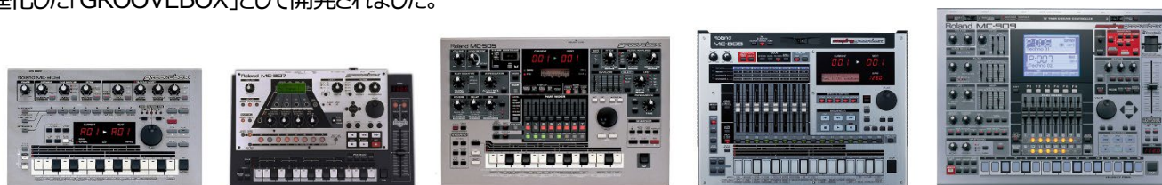
画期的な音楽制作ツールとして人気を博した「GROOVEBOX」シリーズ。 左から「MC-303」（1996年発売）、「MC-307」（2000年発売）、「MC-505」（1998年発売）、 「MC-808」（2006年発売）、「MC-909」（2002年発売）

今回発売する『MC-707』『MC-101』は、「GROOVEBOX」のコンセプトを継承しつつ、現在のエレクトロニック・ミュージックの制作に必要とされる機能やサウンドを備え、さらに最新のクリップや音色データを取り込んで、いつでも最先端の音楽制作を1台で実現する、進化した「GROOVEBOX」として開発されました。