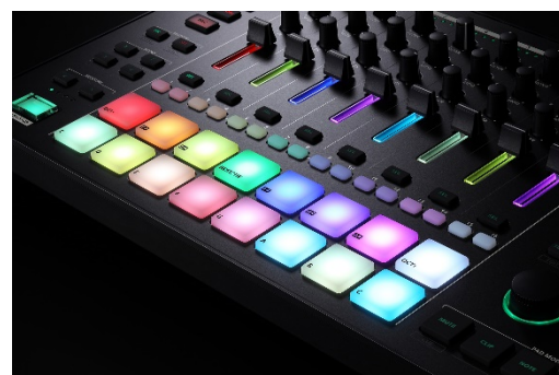
フレーズ入力などをスムーズに行う 16 個のパッド (写真は『MC-707』)