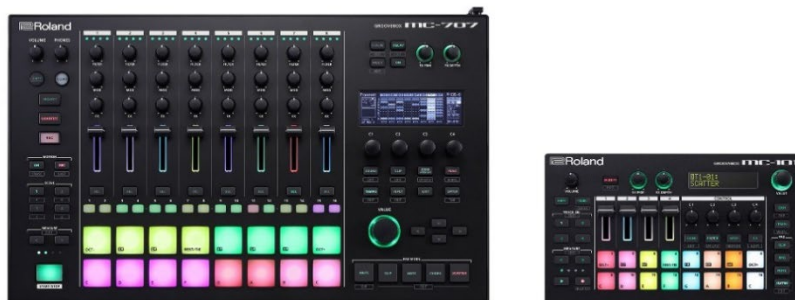
GROOVEBOX 『MC-707』 (左) と『MC-101』

ローランド株式会社は、「AIRA」シリーズの最新機種として、シーケンサー (※1) やシンセサイザーなど、エレクトロニック・ミュージックの制作やパフォーマンスに必要な機能を 1 台に集約した「GROOVEBOX (グルーブボックス)」シリーズの『MC-707』と『MC-101』を、2019 年 9 月 21 日 (土) に発売します。