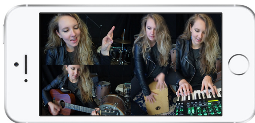
『4XCAMERA』イメージ (画面 4 分割時)

ローランド株式会社は、iPhone/iPad だけで画面分割の本格的な演奏動画を簡単に作成できるアプリ『4XCAMERA (フォーエックスカメラ)』(iOS 版) を、2018 年 1 月 8 日 (月) に App Store で配信開始しました。