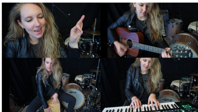
『4XCAMERA』スクリーンショットのイメージ（画面4分割時）