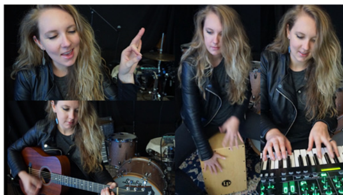
『4XCAMERA』スクリーンショットのイメージ（画面4分割時）