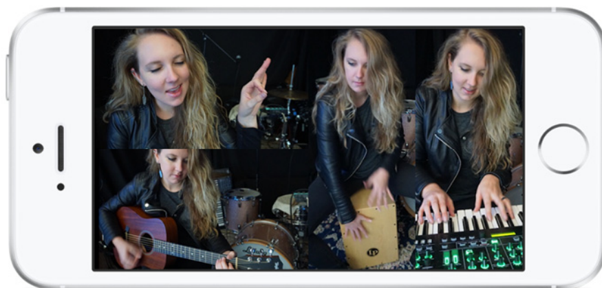
『4XCAMERA』イメージ（画面4分割時）