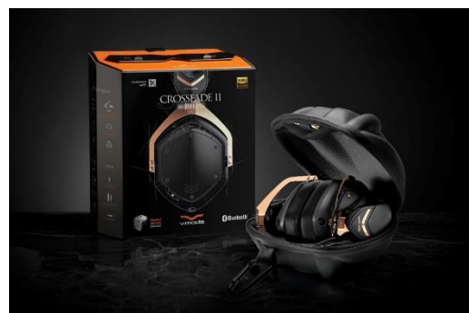
本体は折りたたんで 付属ケースにコンパクトに収納

『Crossfade II Wireless』では、本体が折りたたみ可能となり、より手軽に持ち運べるようになりました。また、新色のローズ・ゴールド・ブラックが追加し、3 種類のカラーバリエーションでファッション性にも優れています。