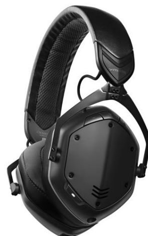
『Crossfade II Wireless』 (マット・ブラック)

※ 製品画像は、ニュースリリース・ページ https://www.roland.com/jp/news/0747/ よりダウンロードいただけます。