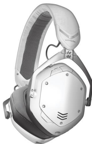
『Crossfade II Wireless』 (マット・ホワイト)