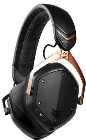
『Crossfade II Wireless』 (ローズ・ゴールド・ブラック)